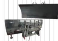
Pług do odśnieżania