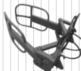
Chwytnak do bel