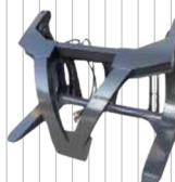
Chwytnak do drewna