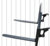
Widły do palet