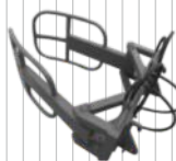
Chwytnik do bel