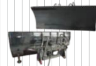
Pług do odśnieżania