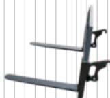
Widły do palet