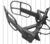
Chwytnik do bel