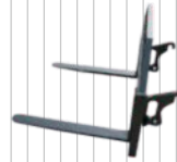
Widły do palet