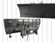
Pług do odśnieżania