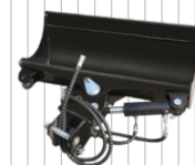
Hydrauliczna łyżka 800 mm