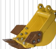
Łyżka 200 mm