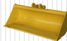
Łyżka 800 mm