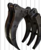
Chwytnak do drewna