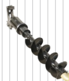
Wiertnica do ziemi