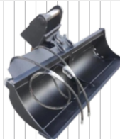
Łyżka hydrauliczna 1000 mm