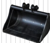
Łyżka 800 mm