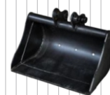
Łyżka 600 mm