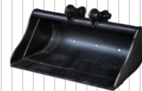
Łyżka 1000 mm