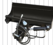
Hydrauliczna łyżka 800 mm